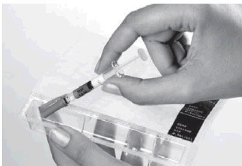
2. Fertigspritze vorsichtig entnehmen.