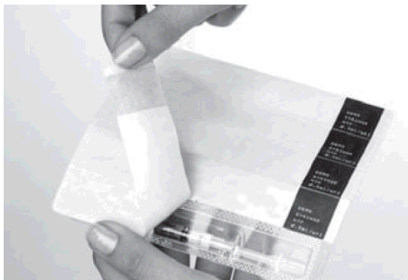
1. Deckfolie vollständig abziehen. Fertigspritze nicht durch die Deckfolie drücken.

Den Kolben nicht vor Injektion betätigen. Die vorhandene Luftblase dient zur vollständigen Entleerung der Spritze und sollte daher nicht entfernt werden.